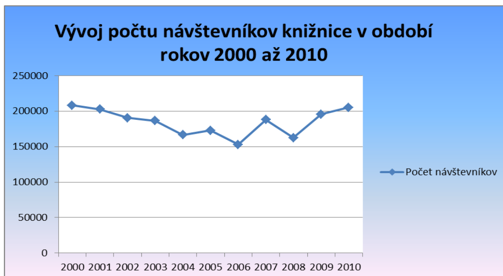
Graf č. 5