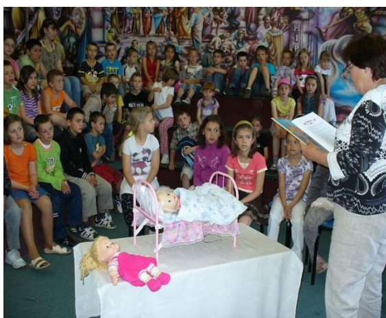
„Ja ako rozprávková bytosť“ – tvorivá dielňa