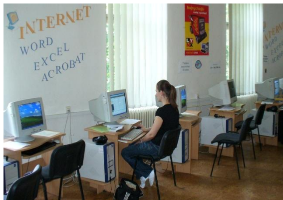
Internet pre verejnosť (Hasičská ul. 1)