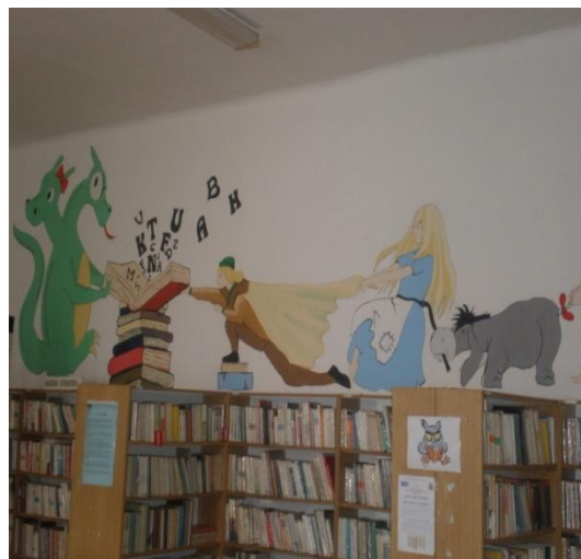
Vymalované priestory v pracovisku pre deti a mládež na Hasičskej ulici