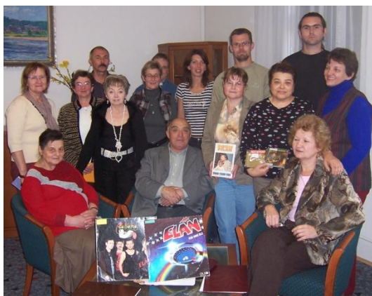
Literárny klub Omega