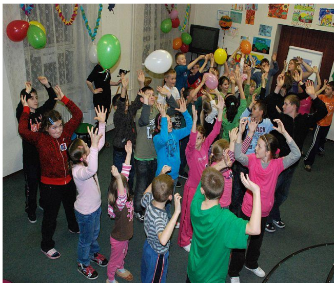
Noc s Andersenom (Hasičská ul. 1, 26.3.2010)