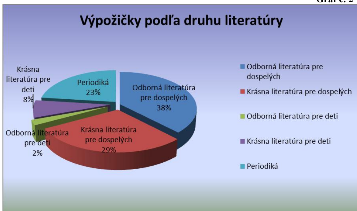
Graf č. 2

Možnosť prístupu na internet využilo 21 347 registrovaných i neregistrovaných používateľov, z toho 3 327 detí do 15 rokov.