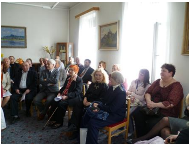
V. stretnutie spisovateľov a literátov Trenčianskeho kraja