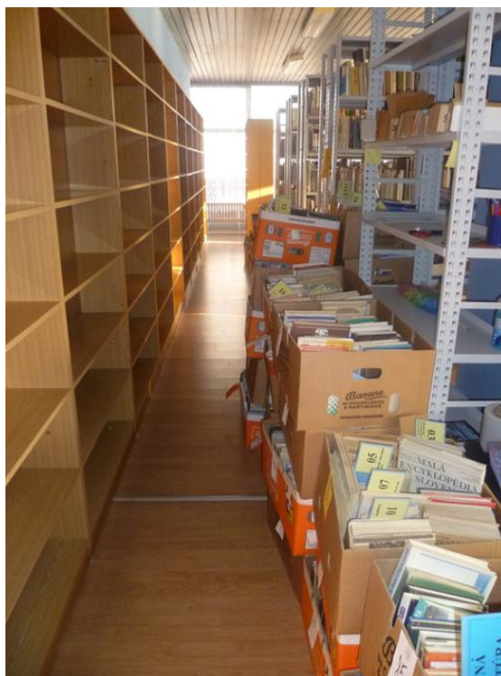
Sťahovanie pracoviska Dlhé Hony

Postupnosť jednotlivých krokov je zaznamenaná v internom zápise Príprava na sťahovanie VKMR, ktorý je súčasťou tlačenej podoby Správy o činnosti a hospodárení za rok 2011.