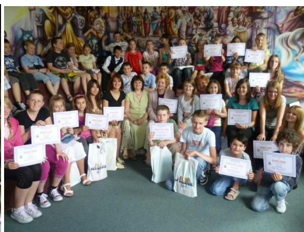
Píšem, píšeš, píšeme