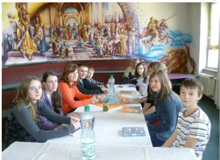
Stretnutie Priateľov knižnice