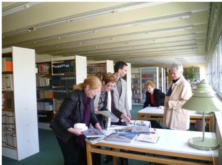
Delegácia VKMR na návšteve v Békešskej Čabe

VKMR v pobočke JUH, v rámci projektu Ministerstva kultúry SR, bezplatne poskytovala prístup na internet deťom i dospelým na vzdelávacie účely. Túto možnosť využilo 1 002 detí a 3 032 dospelých návštevníkov.