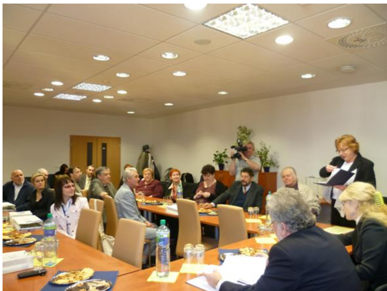
Prijatie trenčianskych literátov u predsedu TSK