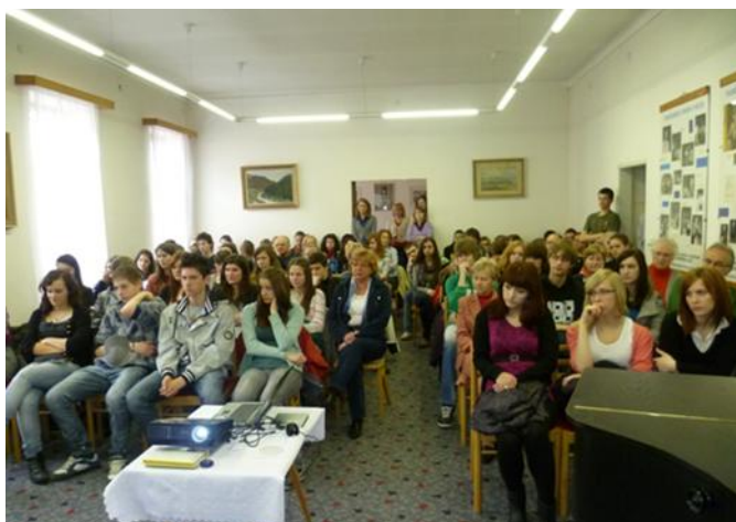
Účastníci besedy s historikom E. Letzom