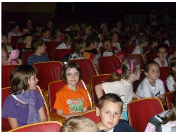
Čítajme všetci – čítanie je super