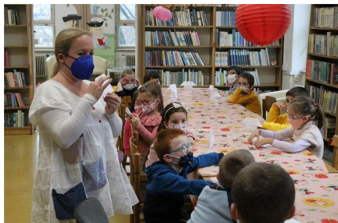
Divadlo TUŠ: predstavenie „Dievčatko s obrovskou fantáziou“ v priestoroch literatúry pre deti a mládež VKMR